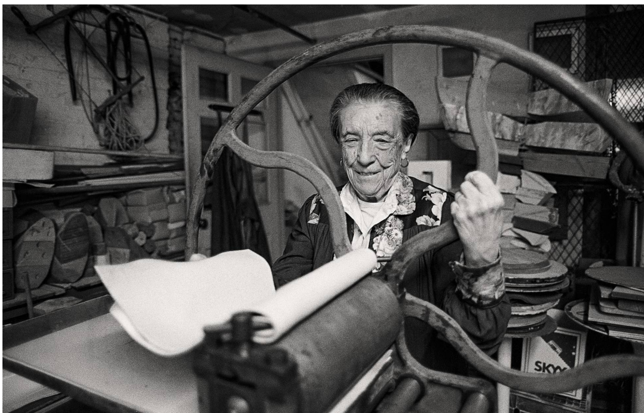
Louise Bourgeois, manejando la prensa que tenía en su casa y estudio en Nueva York, en 1995.

De las cartas de Gustav Klimt a las máscaras de Aby Warburg, pasando por una biografía impresionista de Louise Bourgeois, proponemos un repaso a los últimos títulos publicados en el campo del arte