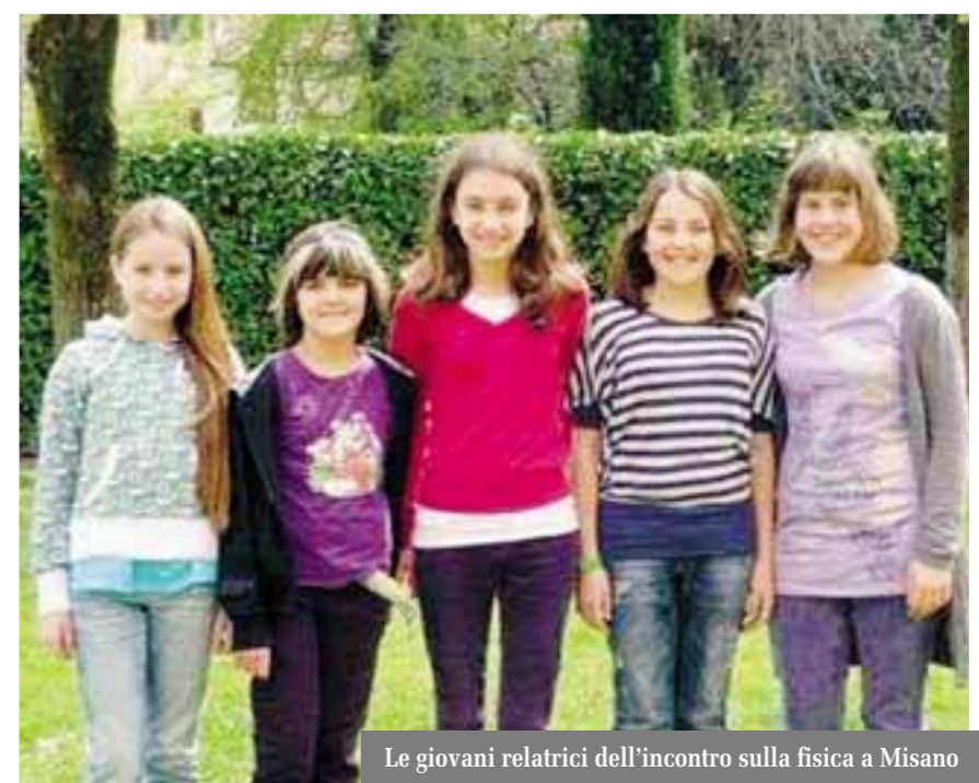
Le giovani relatrici dell'incontro sulla fisica a Misano