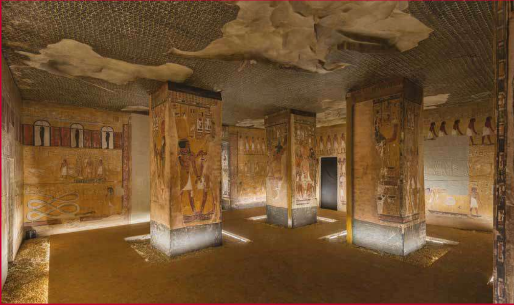
Facsímil exacto de la Sala J de columnas de la tumba de Seti I en su estado actual. El facsímil se formó parte de la exposición Scanning Seti: The Re-generation of a Pharaonic Tomb en el Antikenmuseum de Basilea (2017-2018).