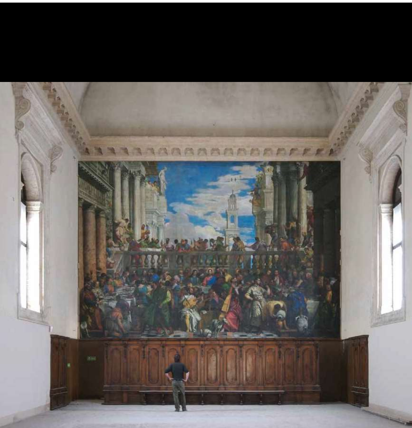
El facsímil hecho por Factum Arte de Las Bodas de Cana de Veronese , en el refectorio de Palladio en la isla de San Giorgio Maggiore, Venecia, el espacio para el que el original fue concebido y pintado.