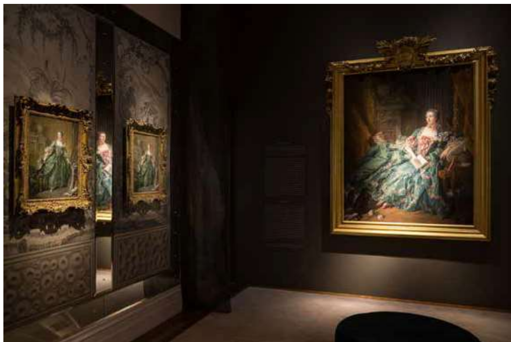
Entrada de la exposición Madame de Pompadour in the Frame , en Waddesdon Manor, organizada por la Fundación Factum y diseñada por Skene Catling de la Peña. A la izquierda, el retrato pequeño y su facsímil; a la derecha, el facsímil del retrato digitalizado en color y 3D en la Alte Pinakothek en Múnich.

Tras años de especialización en la documentación y reproducción de objetos por medios digitales, el trabajo de la Fundación Factum sugiere que la originalidad de un objeto, lejos de ser algo estático e inmutable, es algo dinámico y en constante transformación, que se construye de nuevo cada vez que se re-presenta en forma de facsímil. El concepto de “aura” entendido como cualidad intrínseca del objeto original, según la referencia de Walter Benjamin en su ya clásico texto de 1936 titulado The Work of Art in the Age of Mechanical