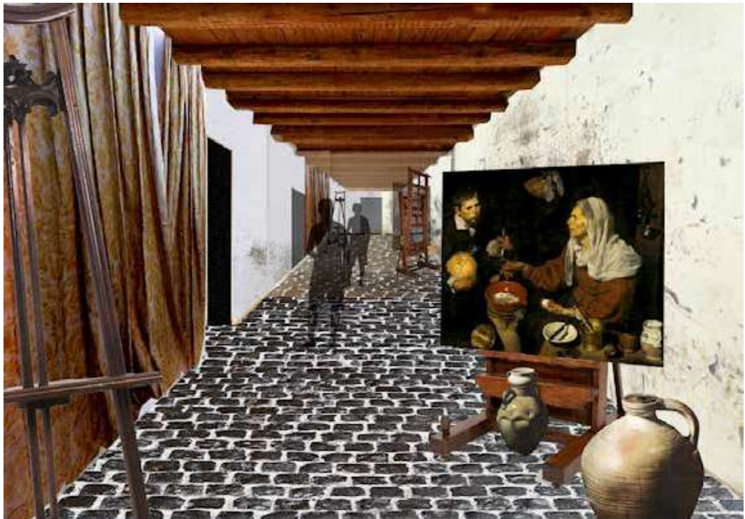
Propuesta de diseño para una de las salas de la Casa Natal de Velázquez por Carlos Bayod, incluyendo el facsímil de la Vieja friendo huevos .

miles de una selección de cuadros de Velázquez de su etapa sevillana (1617-1623). Estos facsímiles, que reproducirán con el máximo detalle el color y relieve de los originales, estarán realizados gracias a la contribución del Centro de Estudios Europa Hispánica, y contarán con la colaboración de los distintos museos a cuyas colecciones pertenecen los originales. El primero de ellos, Vieja friendo huevos (1618) ya ha sido escaneado en la National Gallery of Scotland (Edimburgo) y el facsímil se encuentra actualmente en su fase final de producción en los talleres de Factum Arte en Madrid. Se prevé además realizar facsímiles de otras obras capitales como El aguador de Sevilla (Apsley House, Londres) o La mulata (National Gallery of Ireland, Dublín) entre otras. La influencia que ejerció en su formación la figura de su maestro (y suegro) Francisco Pacheco o la propia ciudad de Sevilla (entonces una de las urbes más importantes y contradictorias del mundo) serán algunos de los temas que se tratarán en el itinerario. La Casa Natal de Velázquez, cuya inauguración se prevé para 2021, buscará convertirse en un centro de referencia para el estudio de la obra de Velázquez y del Siglo de Oro español en general, con capacidad de atraer la atención tanto de expertos como de público interesado en conocer de primera mano el entorno en el que se formó el artista. En este momento, la incertidumbre que rodea al presente y futuro de los museos nos obliga a recon-