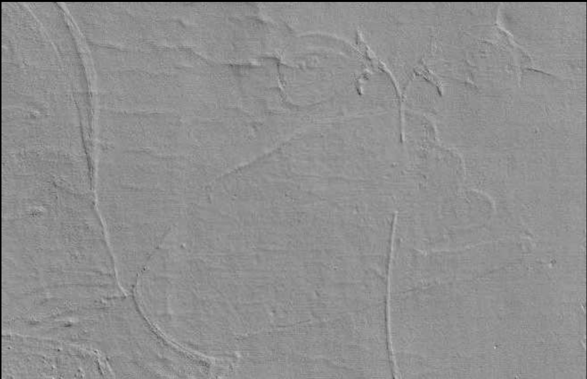
Renderizado 3D de los ojos de Santa Lucía.