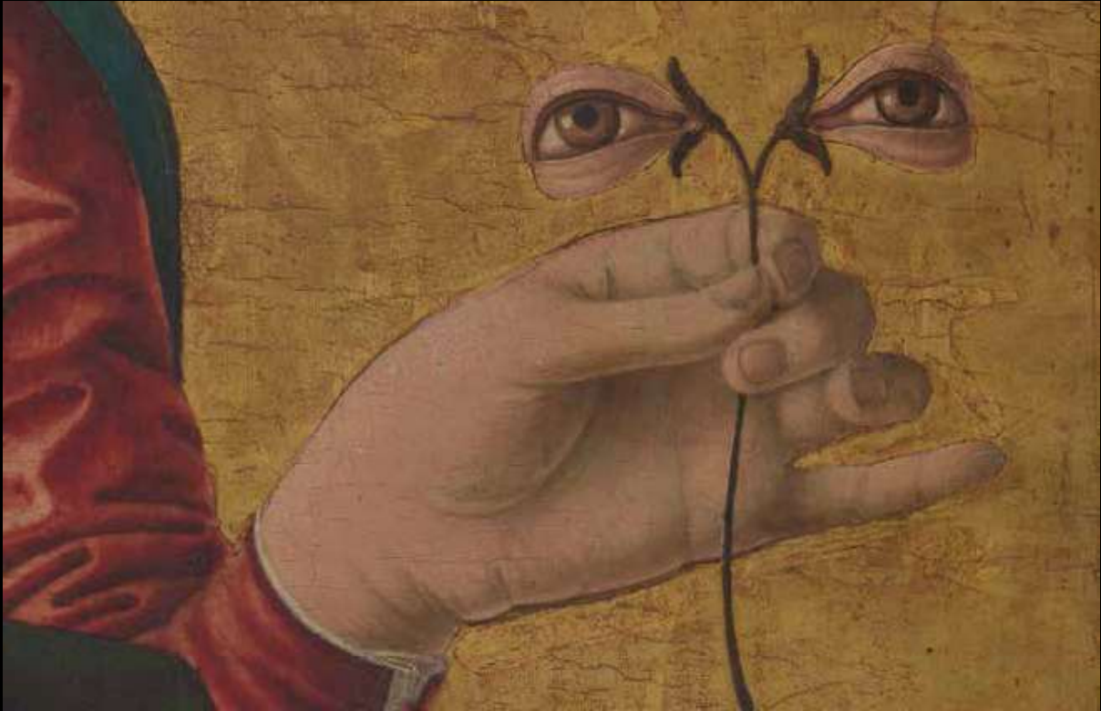
Datos de color de los ojos de Santa Lucía del Polittico Griffoni, digitalizado en la National Gallery of Art en Washington, usando el escáner Lucida 3D.