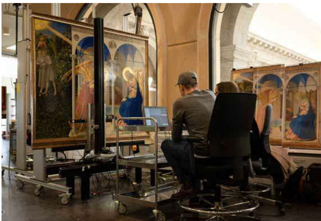
El equipo de Factum con el escáner 3D Lucida, digitalizando la superficie de La Anunciación de Fra Angelico en el Departamento de Conservación del Museo del Prado.

La superficie de las obras de arte se presenta de diferentes maneras en las restantes salas de la exposición, a través de distintas reproducciones de esculturas, bajorrelieves, mapas o manuscritos. Las re-materializaciones abarcan muchas de las técnicas con las que habitualmente trabaja la Fundación Factum, y ponen de manifiesto la importancia de la documentación digital para la supervivencia del Patrimonio histórico. Todas las piezas en exposición tienen su origen en un trabajo de escaneo digital del original. Los archivos digitales obtenidos, que en todos los casos pertenecen a la institución responsable de la conservación de la obra original, conforman el verdadero repositorio de información