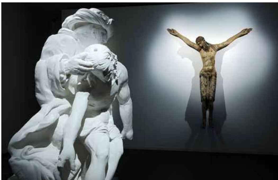
En primer plano, la impresión 3D a escala real de la Deposición de Cristo de Amico Aspertini (1526–30), del pórtico derecho de San Petronio en Bolonia, 2020. En el fondo, el facsímil en madera del Cristo de Auvernia , perteneciente a la colección del Musée de Cluny de París, un encargo del artista Rachid Koarichi a Factum Arte.