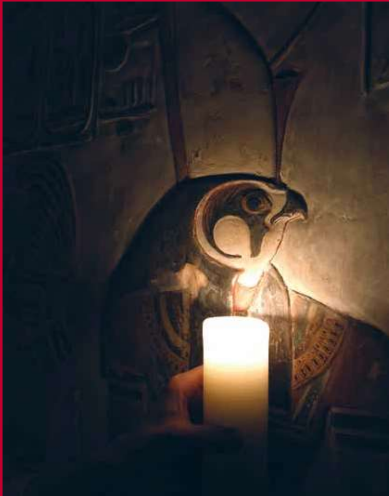
Sosteniendo una vela en frente de la cabeza de Horus, en la recreación de la Sala de las Bellezas de la tumba de Seti I, como lo vio Belzoni en 1817. El facsímil formó parte de la exposición Scanning Seti: The Re-generation of a Pharaonic Tomb en el Antikenmuseum de Basilea (2017-2018).