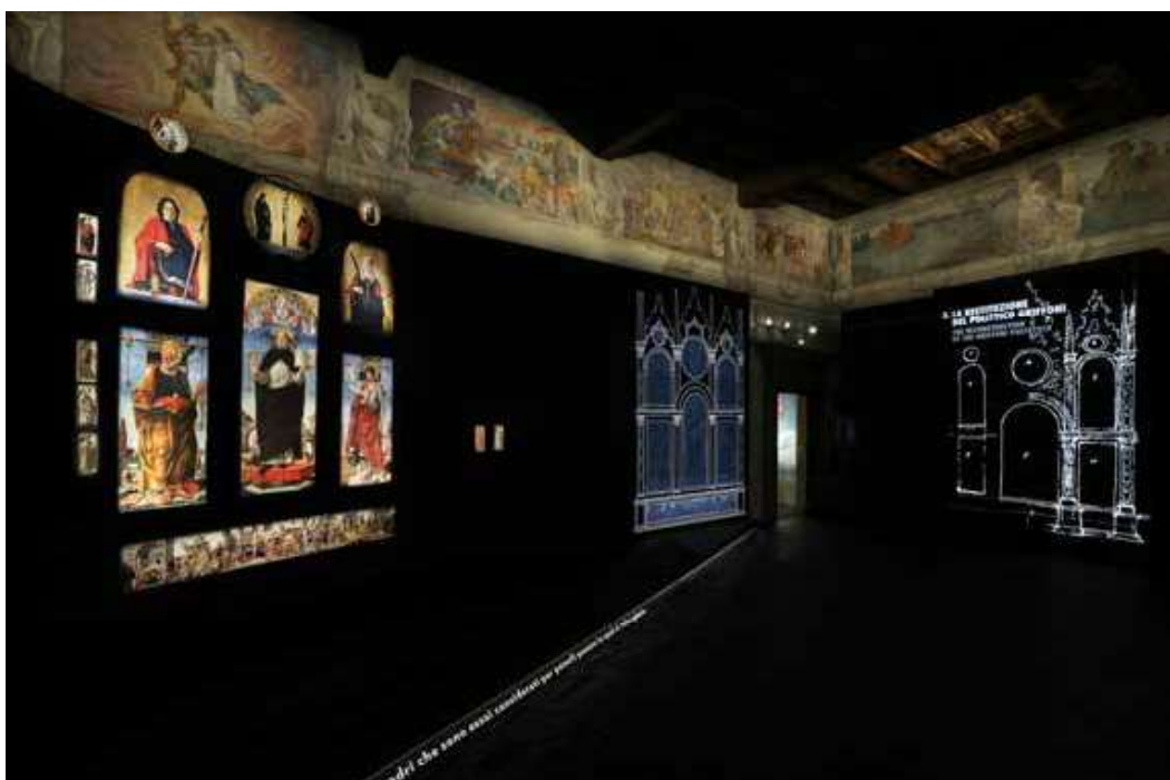
El facsímil del Polittico Griffoni en la exposición The Materiality of the Aura. New Technologies for Preservation (18 Mayo – finales del 2020) en Palazzo Fava, Bologna; comisariado por Adam Lowe, Guendalina Damone y Carlos Bayod Lucini.

La muestra comienza precisamente poniendo el foco en la textura de las pinturas. El sutil relieve de los cuadros es un aspecto generalmente ignorado,