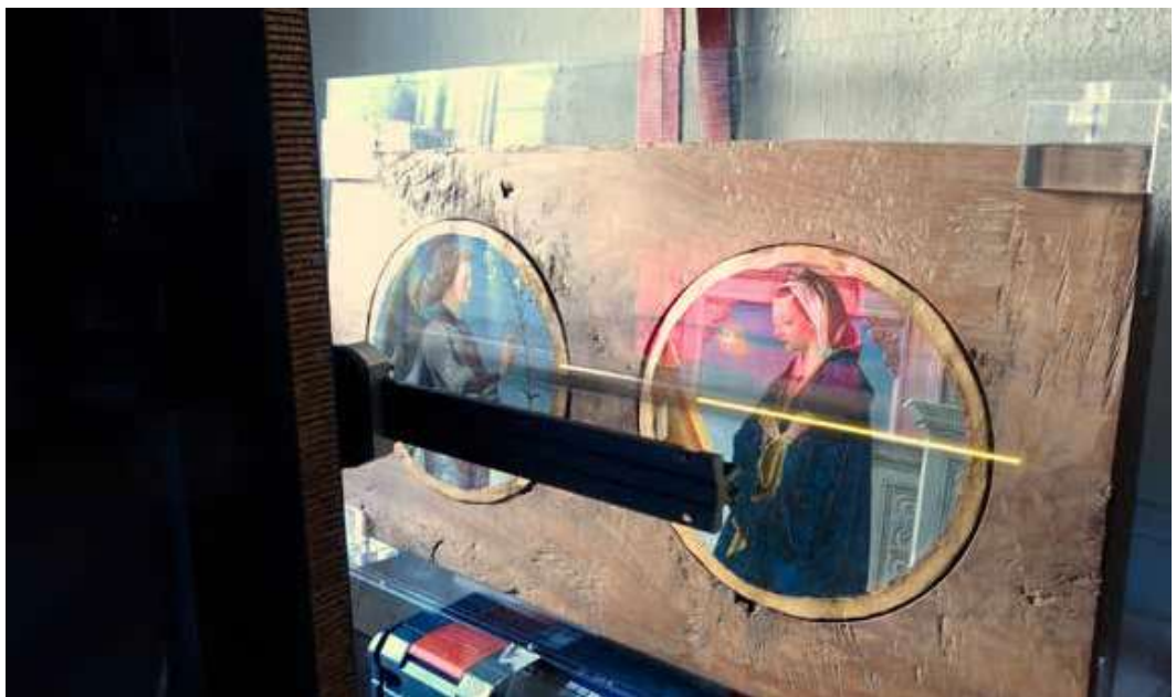
El escáner 3D Lucida digitalizando la superficie de la Anunciación del Angel y la Anunciación de la Virgen en el Museo di Villa Cagnola (Gazzada), del Polittico Griffoni en 2012.

La Riscoperta di un Capolavoro (El Redescubrimiento de una Obra Maestra) es el nombre de la muestra en el Palazzo Fava de Bolonia que reúne por primera vez los dieciséis paneles del retablo conocido como Polittico Griffoni (1470-1472). Obra realizada por Francesco del Cossa y Ercole de'Roberti, el Polittico Griffoni es considerada una de las cumbres del renacimiento boloñés y fue realizada originalmente para la capilla de la familia Griffoni en la Basílica de San Petronio, dedicada a San Vicente Ferrer. Desde 1725 el retablo se encuentra desmembrado, y los paneles están dispersos en museos como la National Gallery (Londres), el Museo del Louvre (París), la Pinacoteca Vaticana o la National Gallery of Art (Washington DC) entre otras colecciones internacionales. La muestra de Bolonia, cuya inauguración prevista para mediados de marzo 2020 tuvo que ser retrasada debido a las medidas adoptadas por causa del Covid-19, abrió sus puertas finalmente el 18 de mayo y se podrá visitar con cita previa hasta el 10 de enero de 2021. La exposición celebra un doble acontecimiento. Por un lado, supone la primera reunifica-