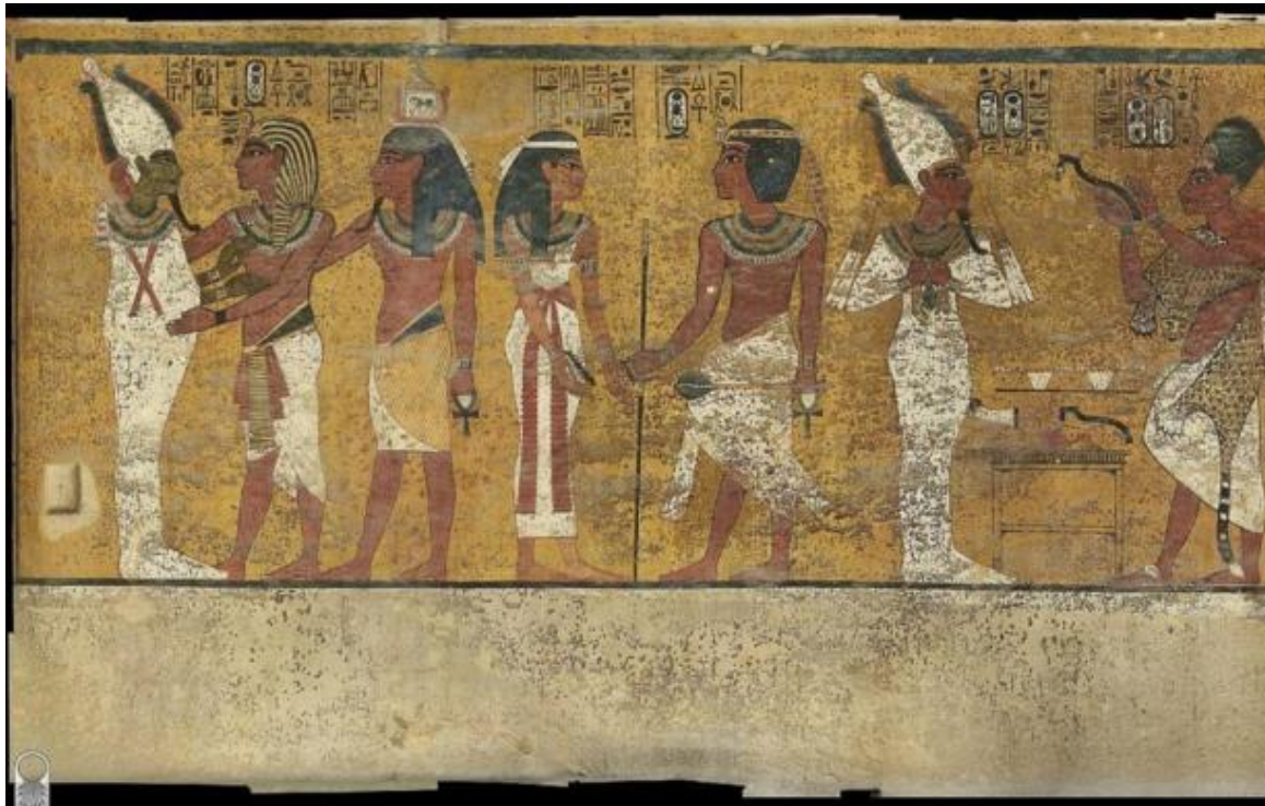
Pinturas en el interior de la tumba de Tutankamón.

El pasado noviembre, en una rueda de prensa celebrada en la ciudad sureña de Luxor, el ministro ya reconoció estar seguro "al 90%" de la existencia de "algo detrás de las paredes". La localización de "espacios vacíos" alimenta la teoría que el egiptólogo británico Nicholas Reeves formuló el pasado agosto y que desde entonces mantiene en vilo a la Egiptología. Según sus cábalas, la probables estancias ocultas de la tumba de Tutankamón albergarían el descanso eterno de la esquivada reina Nefertiti , consorte, corregente y tal vez sucesora de Akenatón. El ministro, sin embargo, ha vuelto a mostrar sus reservas. "Es probable que se trate de una tumba de otro miembro real, tal vez de una mujer . Si fuera la de Nefertiti sería algo muy importante para la Historia de Egipto y la Humanidad. Yo creo que nos podríamos encontrar a Kiya [segunda esposa de Akenatón y madre de Tutankamón] o Meritaton [primogénita de Akenatón y Nefertiti que se convertiría después en su esposa]", ha insistido El Damati.