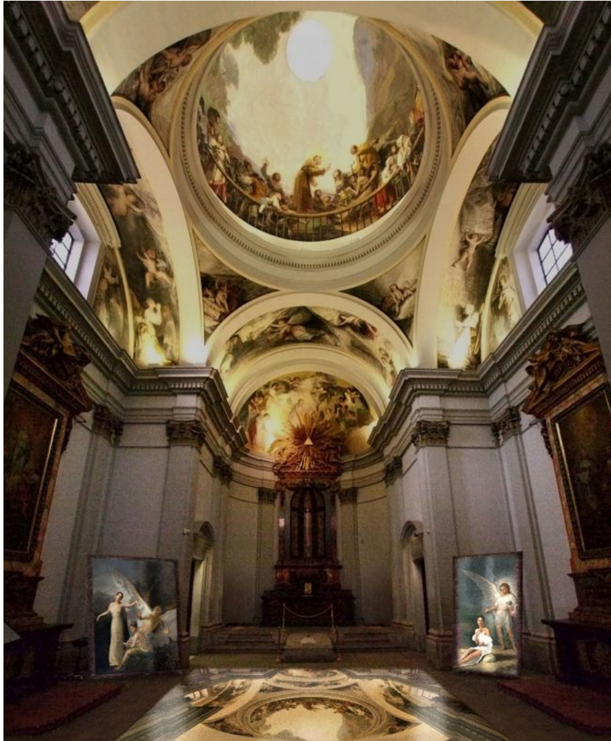
Aspecto de la instalación, con las fotografías de gran formato y un enorme espejo sobre el que se puede caminar y ver los frescos sin levantar la vista.

La Ermita de San Antonio de la Florida es obra del arquitecto Felipe Fontana y se abrió en 1798. Destaca por acoger los frescos de Goya , considerados como una de sus obras maestras.