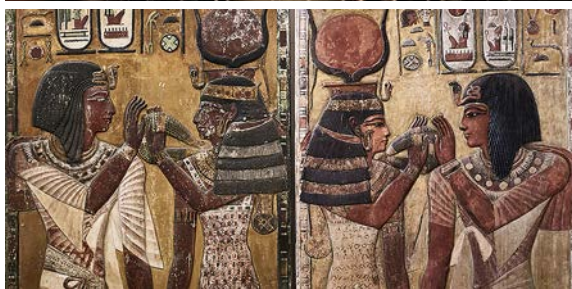
“IN SITU”. Arriba, investigadores de Factum escanean la tumba de Seti I en Luxor. Sobre estas líneas detalle de su facsímil.

pecto económico. “¿Que si somos muy caros?”, rebate cuando se le pregunta directamente por el asunto. “Depende de lo que se entienda por ‘muy caros’. Las cosas cuestan lo que cuestan. Hacerlas muy bien cuesta más que hacerlas mal, eso es un hecho, pero puedes gastar un montón de dinero en hacerlas muy mal. Creo que para mí es muy barato si contribuye a preservar el conocimiento de nuestra herencia y civilización. El dinero es un concepto relativo”. Cada proyecto implica como mínimo varios meses de trabajo, algunos como el de la tumba de Seti I se inició en 2001 y aún se trabaja en él. Aunque no reciben ayudas, Factum Foundation cuenta con colaboraciones como la del Banco de Santander, que les ha acompañado financieramente en su crecimiento. Además, añade, “Acciona se va a hacer cargo de la salas del nuevo Museo Egipcio [cuya inauguración se prevé para 2019 junto a las pirámides de Guiza] que van a contener nuestros escaneos de los sarcófagos del Valle de los Reyes”.