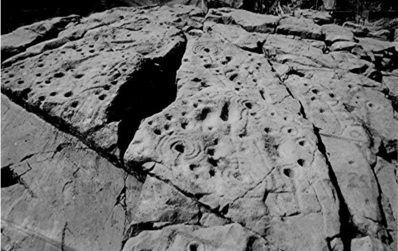
Piedra Cochno, un panel de 9 x 19 m en una fotografía del arqueólogo Ludovic Maclellan, realizada en 1937.

Contiene los enigmáticos diseños de cazoletas y anillos, de los cuales surgen numerosas teorías.