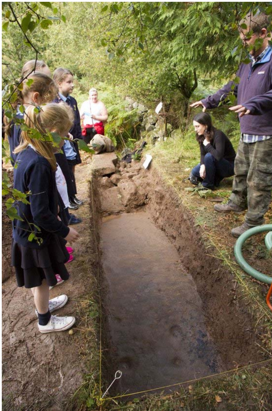
Excavación de 2015 para revelar parte de la Piedra Cochno.

En 2015, los arqueólogos hicieron una excavación preliminar (de 4 x 1 metros), que confirmó que la piedra, de arenisca, se encuentra en buen estado.