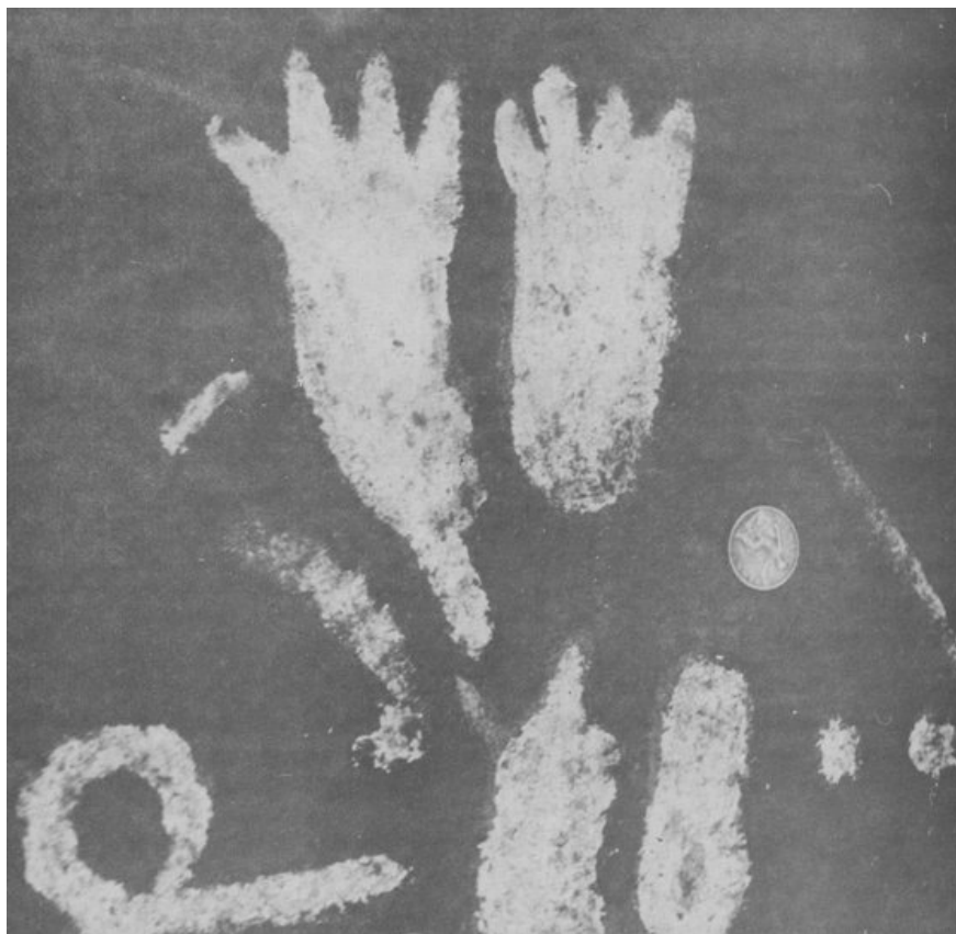
Patas de 4 dedos en la Piedra Cochno, un panel de 9m x 19m en Escocia. Fotografía del arqueólogo Ludovic Maclellan, realizada en 1937.

“Con la piedra Cochno, vamos a utilizar métodos de escaneado 3D y queremos atraer la atención del mundo sobre una herencia misteriosa y hermosa e igualmente importante de Escocia”, explicó el líder del equipo, Fernando Saumarez Smith.