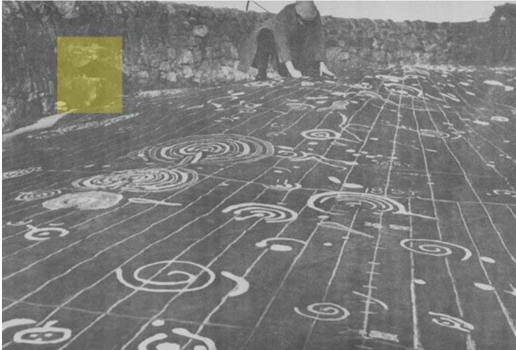
Piedra Cochno con sus diseños retocados. Es un panel de 9m x 19m. Fotografía del arqueólogo Ludovic Maclellan, realizada en 1937.

años se cambió el uso”, según comunicó la Fundación Bradshaw , al revelar los planes de financiación para hacer visible esta valiosa pieza prehistórica.